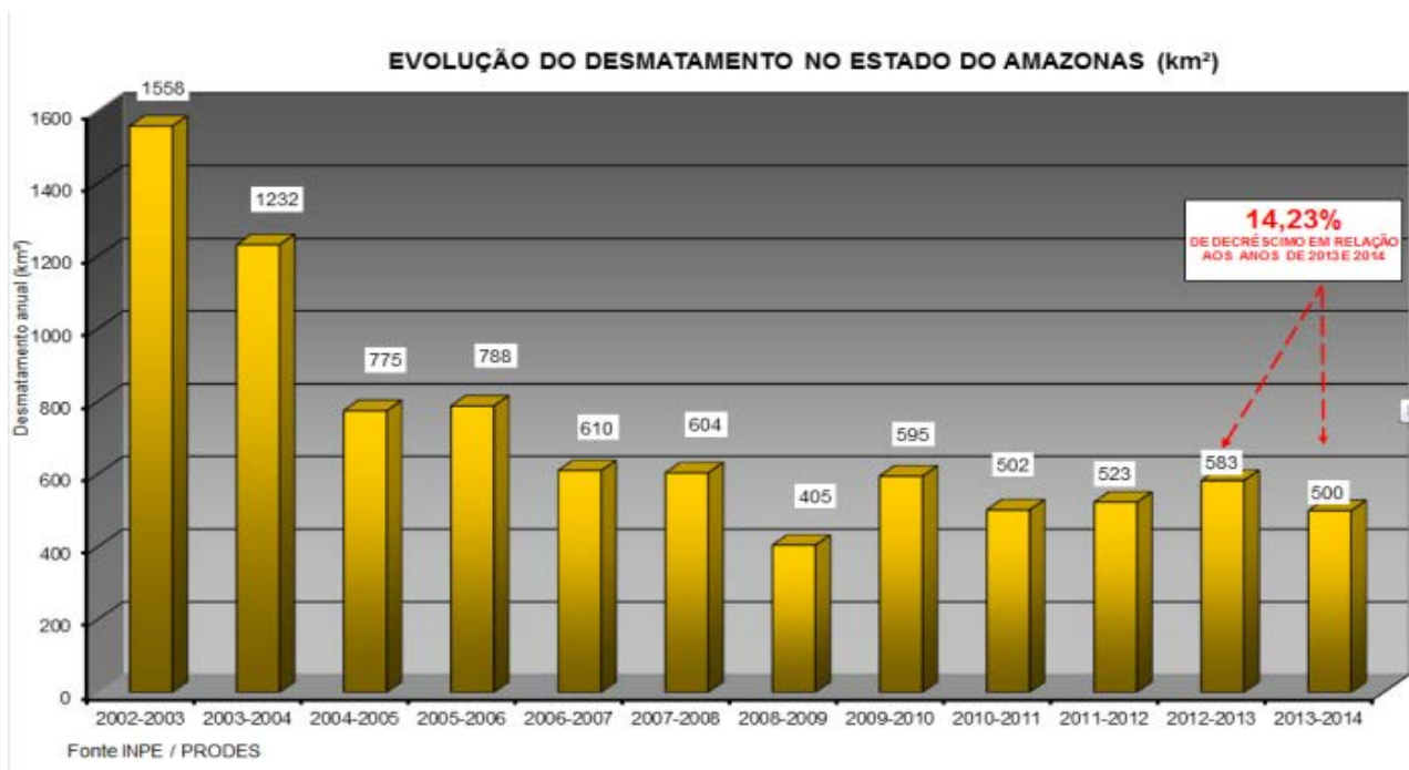
Figura 1 - Evolução do desmatamento para os anos 2004 a 2014

A taxa de 500 km 2 representa para o estado do Amazonas uma redução de - 83 km 2 em relação ao ano de 2013 (583km 2 ), o que representa -14,23% de redução no desmatamento para o período 2013/2014 conforme figura 1: